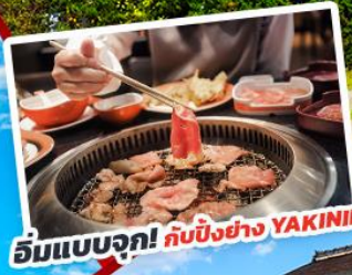
อิ่มแบบจุก! กับบิงย่าง YAKINIKU

AirAsia X เดินทาง ตุลาคม 2566 สายการบิน Thai AirAsia X (XJ) น้ำหนักกระเป๋า 20 KG