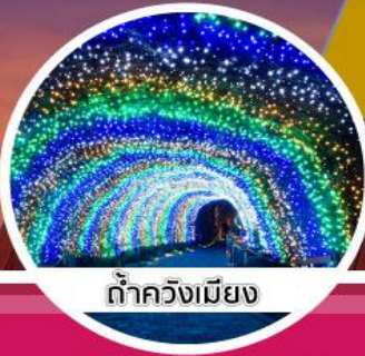
ถ้าควังเมียง