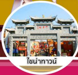
โซน่าทาวน์