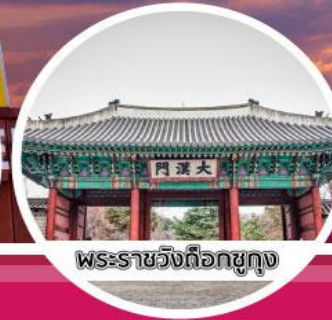
พระราชวังถ็อกซูกุง